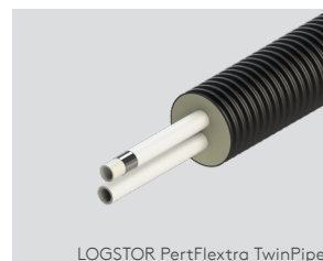
LOGSTOR PertFlextra TwinPipe