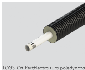
LOGSTOR PertFlextra rura pojedyncza

Średnice rury przewodowej 25 – 63 mm i wymiary płaszcza zawnętrznego 90 – 180 mm.