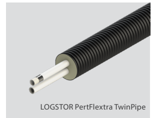
LOGSTOR PertFlextra TwinPipe