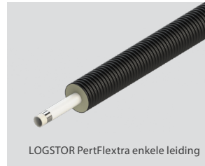
LOGSTOR PertFlextra enkele leiding

Maat serviceleiding 25 – 63 mm en maat buitenmantel 90 – 180 mm.